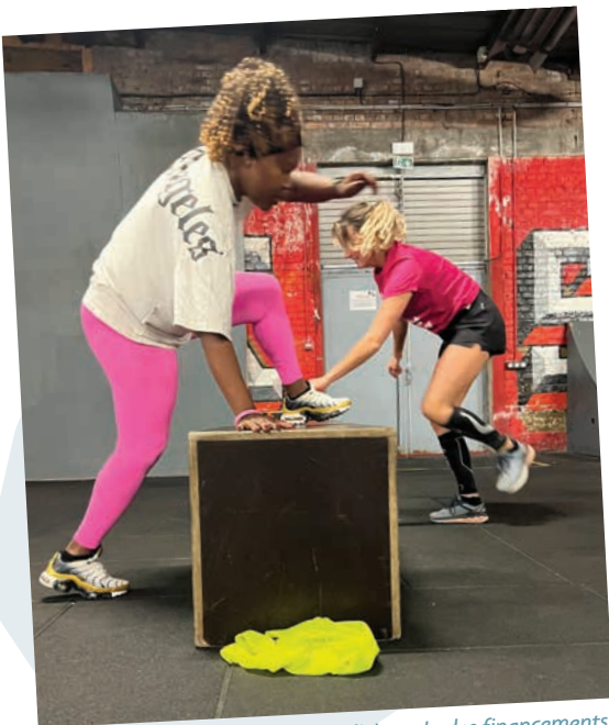
Le parcours d'obstacle des financements.

Des organisations indispensables pour les territoires, les habitants et leur environnement ne peuvent plus exercer leurs missions correctement. Pourtant, l'économie solidaire crée des emplois durables et soutenables, évite des coûts futurs pour la société, réduit les dépendances aux contextes internationaux. Ce sont des structures qui tricotent, maille après maille, un écosystème en proximité, où les coopérations se nouent au fur et à mesure que la confiance se construit. Depuis parfois des dizaines d'années, elles agissent sur des territoires dont elles connaissent les moindres recoins, s'adaptent aux besoins, impliquent les habitants dans une démarche de « faire avec », coconstruisent des solutions avec les collectivités... Aujourd'hui, le tissu patiemment fabriqué se détricote. Quelles solutions s'offrent à elles ? Trier les publics par leur capacité financière à payer des services, sacrifier la qualité des actions au profit de la quantité,