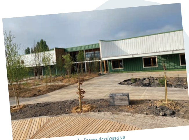
La Réserve a été rénovée de façon écologique